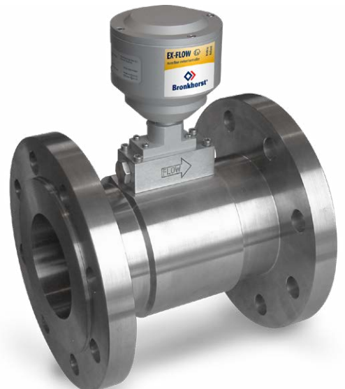
F-107CX 大流量质量流量计 (法兰式)