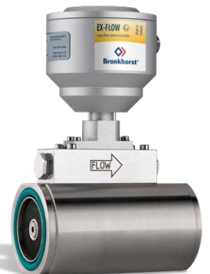
F-106AX 高流量防爆质量流量计